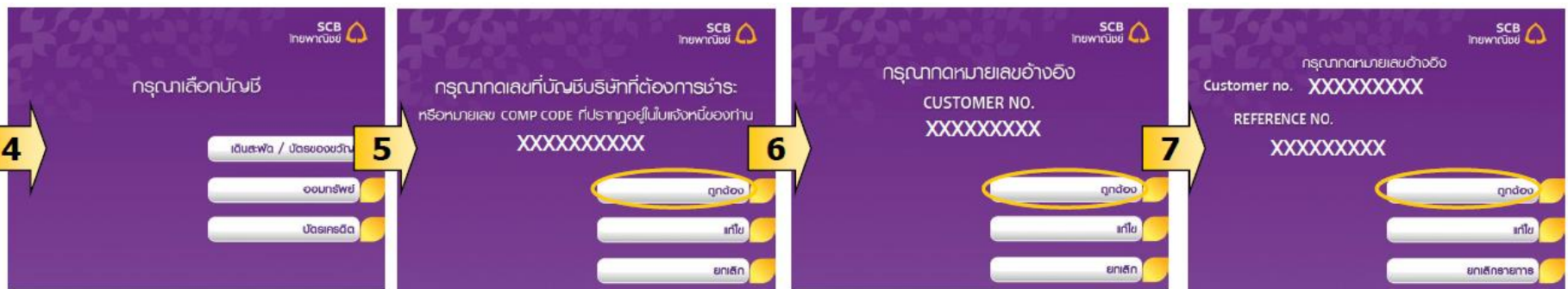
4. เลือก ประเภทบัญชีผู้ชำระ สามารถชำระได้ด้วยบัญชีออมทรัพย์ และกระแสรายวัน