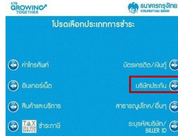
4. เลือก บริษัทประกัน