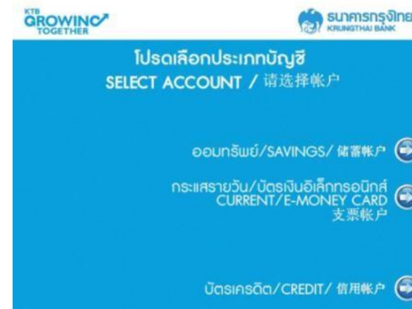
6. เลือก ประเภทบัญชี