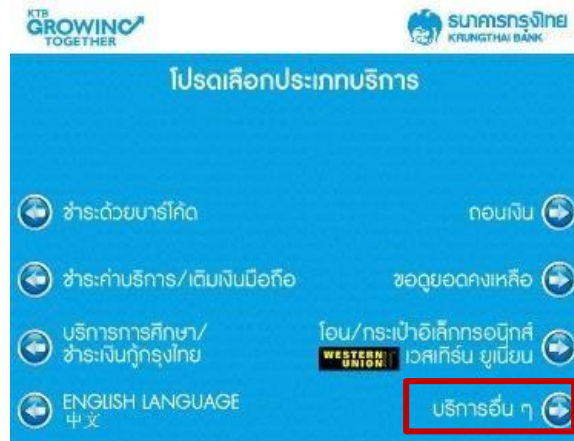
3. เลือก บริการอื่น ๆ