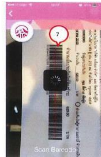
7. ใช้กล้องถ่ายภาพจากโทรศัพท์เคลื่อนที่ อ่านค่าบาร์โค้ดจาก ใบแจ้งกำหนดชำระเบี้ยประกันภัย