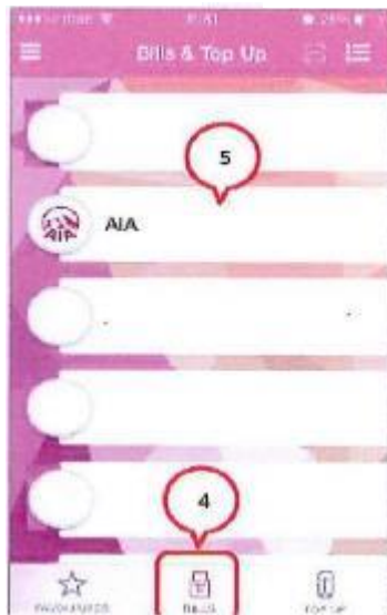
4. แตะไอคอน Bills เพื่อชำระค่าเบี้ยประกัน 5. แตะไอคอนบริษัท "AIA"