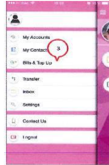
3. แตะที่เมนู "Bills & Top Up" เพื่อชำระค่าเบี้ยประกัน ตามใบเดือนถึงกำหนดชำระเบี้ยหรือเติมเงินค่าบริการ