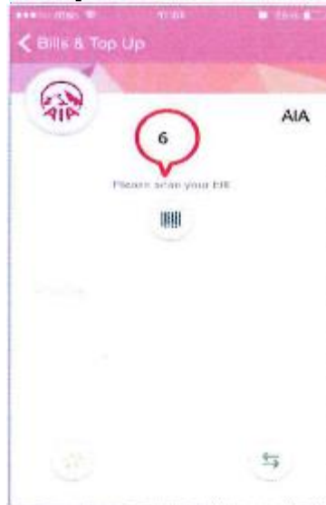
6. แตะไอคอน เพื่อสแกนบาร์โค้ด