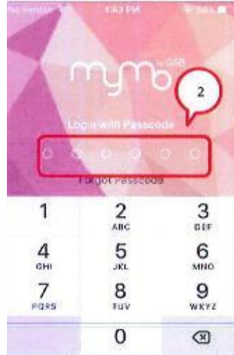
2. ผู้ใช้บริการใส่ Passcode จำนวน 6 หลัก ตามที่ผู้ให้บริการได้กำหนดไว้