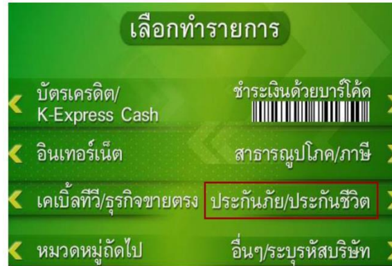
2. เลือก ประกันภัย/ประกันชีวิต