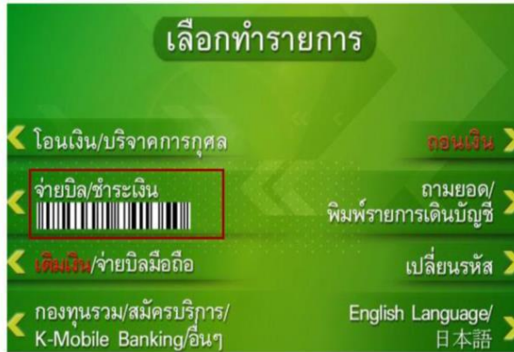
1. เลือก จ่ายบิล/ชำระเงิน