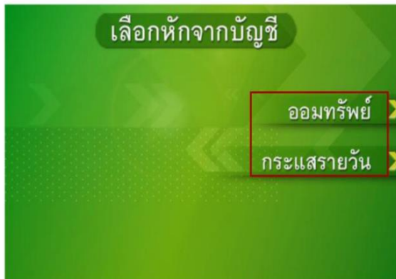
4. เลือกประเภทบัญชีผู้ชำระ สามารถชำระได้ด้วยบัญชีออมทรัพย์ และกระแสรายวัน