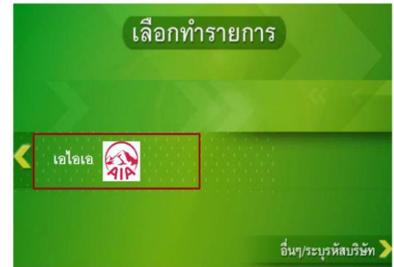
3. เลือก เอไอเอ