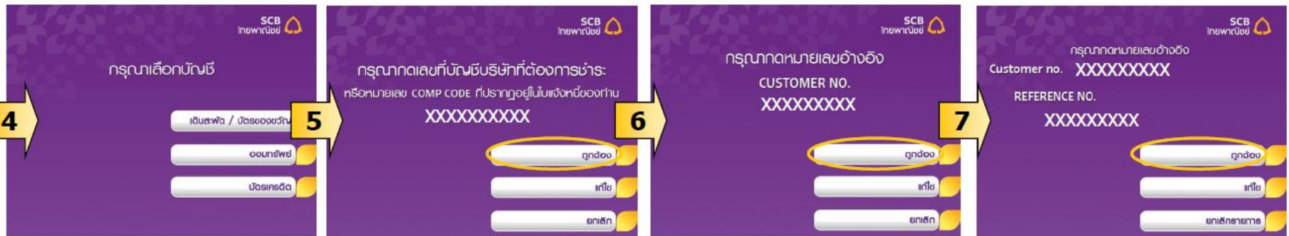
4. เลือก ประเภทบัญชีผู้ชำระ สามารถชำระได้ด้วยบัญชีออมทรัพย์ และกระแสรายวัน