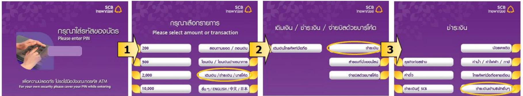
กรุณาใส่รหัสของบัตร