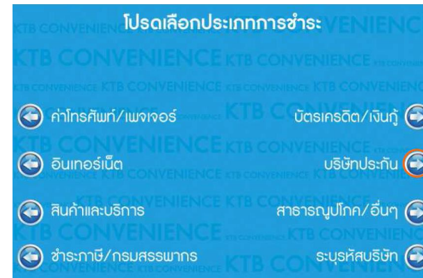
4. เลือก บริษัทประกัน