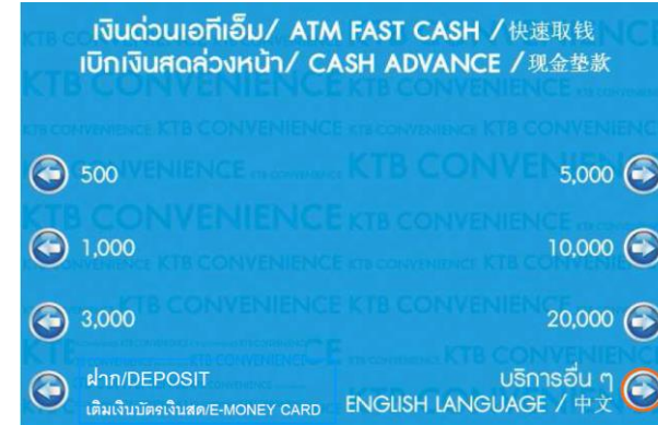
2. เลือก บริการอื่น ๆ