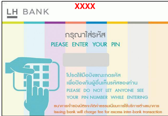
1. ใส่รหัสของบัตร