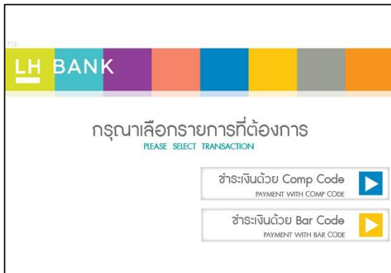
4. วิธีชำระเงินสามารถทำได้ 2 แบบ