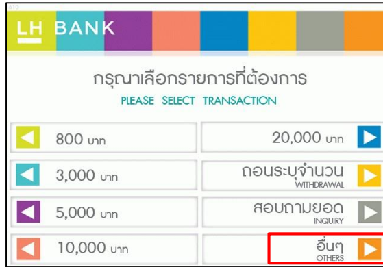
2. เลือก อื่นๆ