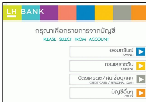
5. เลือก ประเภทบัญชีผู้ชำระ สามารถชำระได้ด้วยบัญชีออมทรัพย์ และกระแสรายวัน