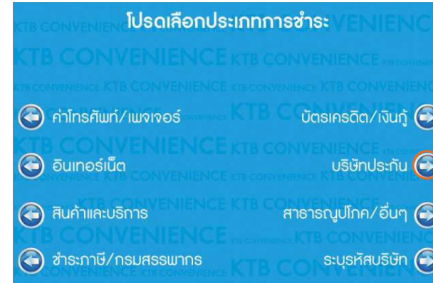
4. เลือก บริษัทประกัน