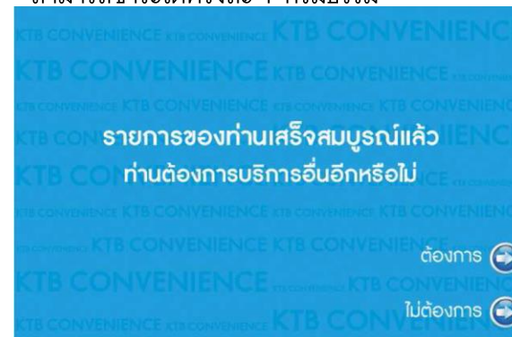
8. ระบบดำเนินการเรียบร้อยแล้วโปรดเก็บสลิป ไว้เป็นหลักฐาน