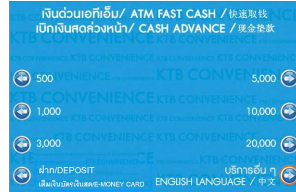
2. เลือก บริการอื่น ๆ