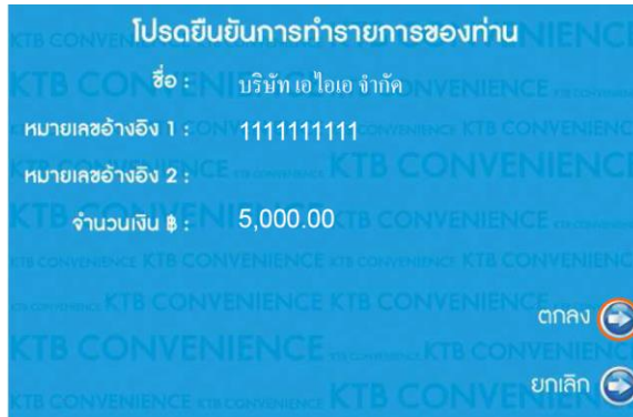
7. Ref.2 ระบุ