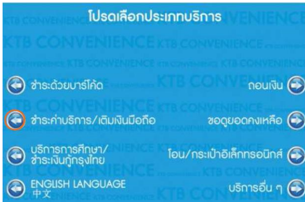
3. เลือก ชำระค่าบริการ/เติมเงินมือถือ