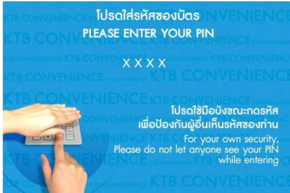
1. ใส่รหัสของบัตร